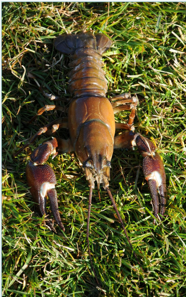
Signalkreps fanget på Ostøya, Bærum kommune i Akershus.

kyst til sub-alpine områder. Signalkreps kan også overleve i brakkevann. Parring og påfølgende egglegging skjer om høsten (oktober), og hunnen gyter mellom 200-400 egg som festes under halen. Her sitter eggene frem til de klekker. Klekkespunktet avhenger av temperatur, og hos villlevende signalkreps varierer klekkespunktet fra slutten av mars til slutten av juli. Etter klekking blir ungene (ligner på miniatyrkreps) hos moren gjennom to skallskifter, før de forlater henne. Signalkreps blir kjønnsmodne når de er 6-9 cm (total lengde; målt fra pannehornet til enden av halefinnen). I tette bestander påvirker kannibalisme og konkurranse overlevelsen. Maksimumstørrelse er rapportert til 16-18 cm, men så store kreps er sjeldne. Bestandsstrukturen er ofte hierarkisk, hvor store individer er dominante og hevder territorier og skjul.